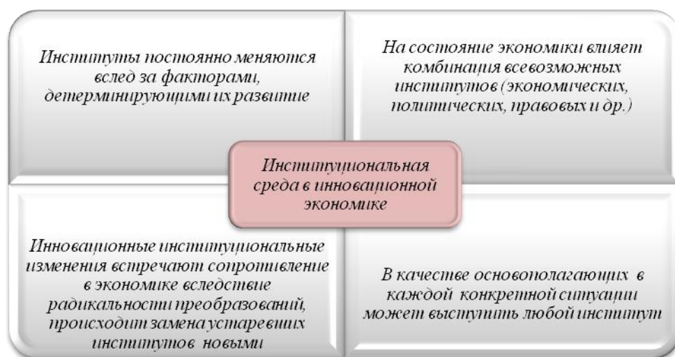
Рис.3. Особенности функционирования институциональной среды в инновационной экономике

В представленной схеме выделены два типа институтов: системные и локально-организационные. Первые определяют тип экономического порядка и обеспечивают эффективное функционирование всей экономической системы, вторые структурируют взаимодействия, связанные с заключением сделок, как на открытом рынке, так и внутри организационных структур, а также способствуют снижению неопределенности, путем установления устойчивой структуры взаимодействия между индивидами, сделок между экономическими субъектами, т.е. они обладают определенной динамикой в своей деятельности. Происходящие инновационные преобразования в научной, экономической и предпринимательской среде обуславливают возникновение инновационных институтов. В рамках совершенствования инновационной деятельности в экономике и ускорения темпов экономического роста спрос на инновационные институты растет, формируя и развивая институциональную среду. Можно выделить ряд особенностей функционирования институциональной среды в инновационной экономике в виде следующей матрицы (рис.3):